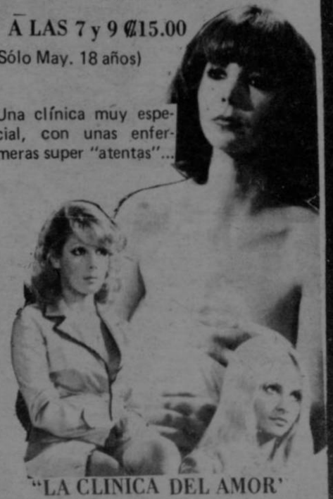
"LA CLINICA DEL AMOR"